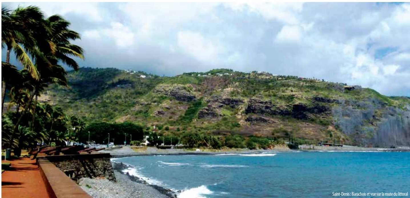
Saint-Denis : Barachois et vue sur la route du littoral