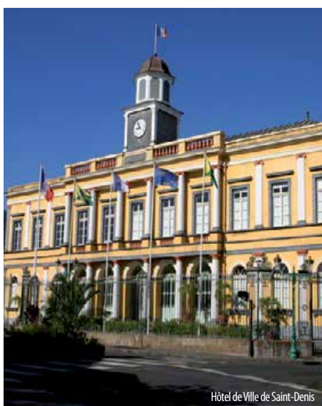
Hôtel de Ville de Saint-Denis