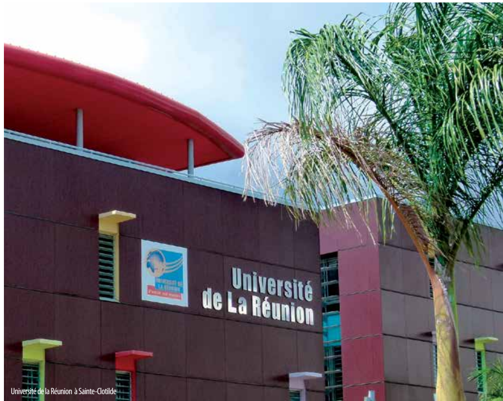
Université de la Réunion à Sainte-Clotilde